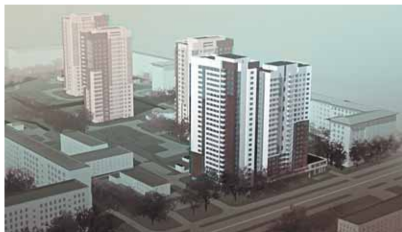
Проект улицы Панферова

Что очень важно, муниципальные дома с улучшенной планировкой квартир несколько не уступают инвестиционным по качеству и архитектуре. Построенные по современным проектам здания отличаются только площадью квартир (по существующим правилам, муниципальное жилье возводится с учетом существующих в городе норм и сдается с полной отделкой). Так что работу ЗАО «Новые Черемушки» уже оценили по достоинству сотни наших жителей, получивших квар-