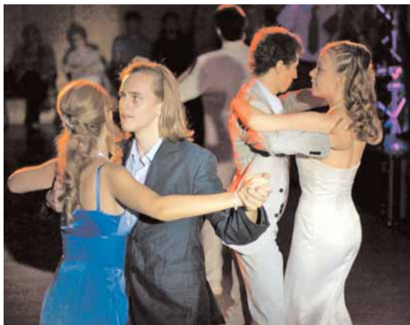
Выпускной вечер в гимназии № 1514